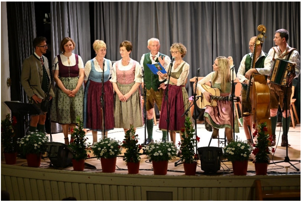
Konzertabend mit dem „Gradner-G’sang“ am Samstag, 20. April 2024 Messgestaltung am Sonntag, 21. April 2024 Marienkirche