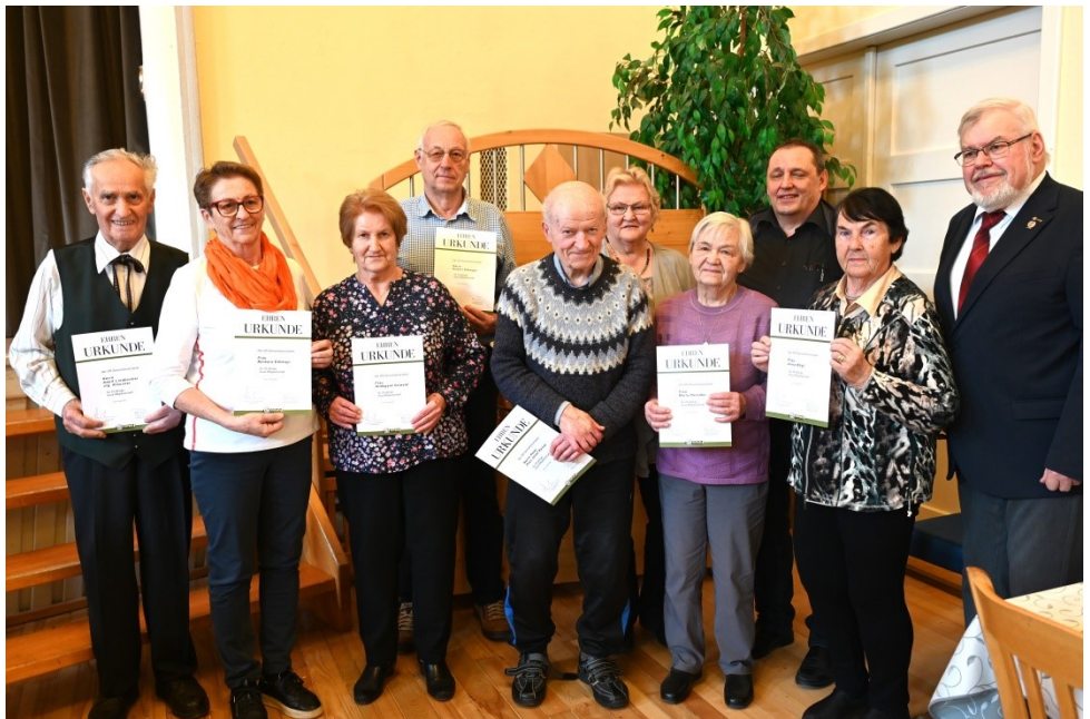
Ehrungen 2024 (25 Jahre)