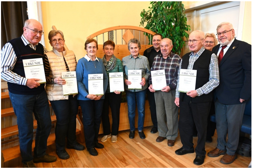
Ehrungen 2024 (20 Jahre)