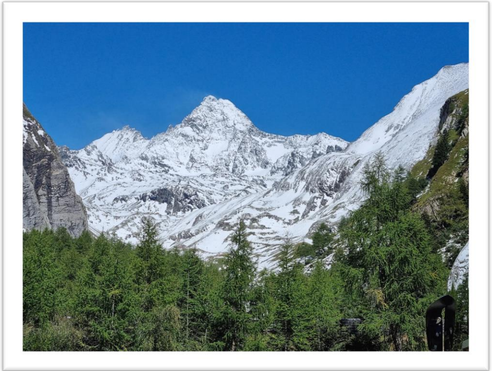
Ein Blick zurück auf den Großglockner