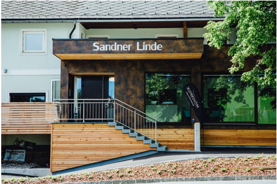
Gasthaus Sandner-Linde (Finner Chr.)