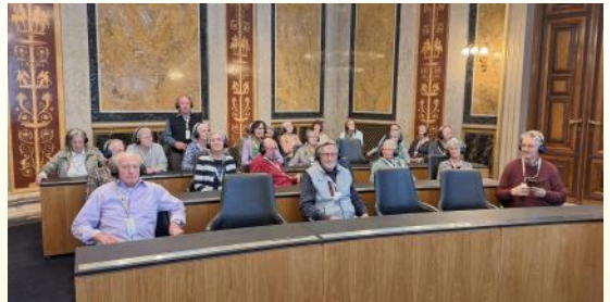
Parlament, Schlumberger Sektkellerei, 04. April 2024