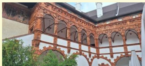
Schallaburg und Stift Melk, 04. Juli 2024