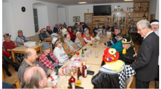
Sparverein-Fasching, 09. Februar 2024

Jahreshaupt-versammlung 05. Februar 2024