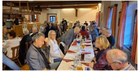
Sparverein-Auszahlung, 08. November 2024