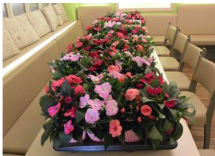
Muttertagfeier, 11. Mai 2024