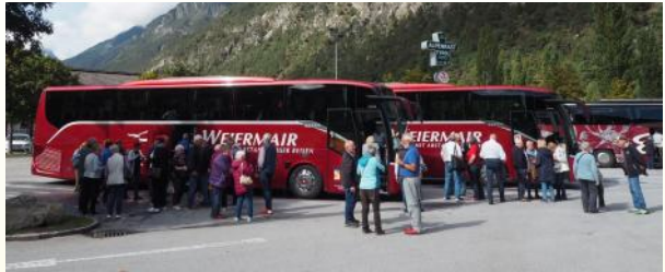
Landeskulturreise Schweiz - Italien - Lichtenstein, 26. bis 29. September 2024