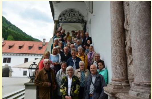
Wallfahrt Mariazell, Gaming, 16. Mai 2024