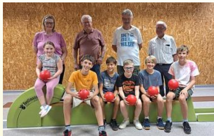
Ferien Aktiv - Kinderkegeln, 24. Juli 2024

Du möchtest mehr Fotos unsere Veranstaltungen sehen? Kein Problem. Auf unserer Homepage findest du jede Menge davon.