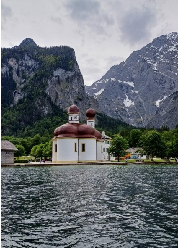
St. Bartolomä am Königsee