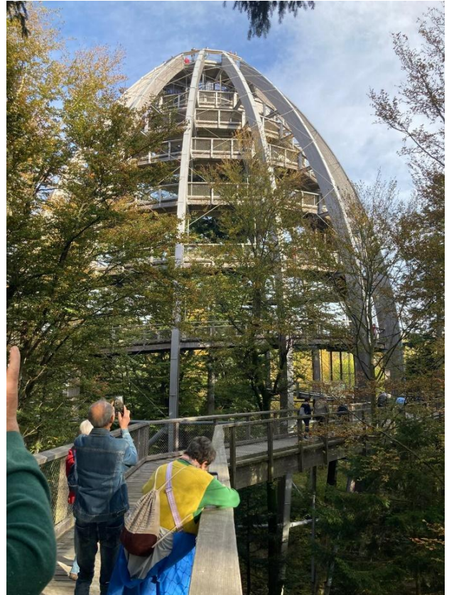
Baumwipfelpfad Bayrischer Wald