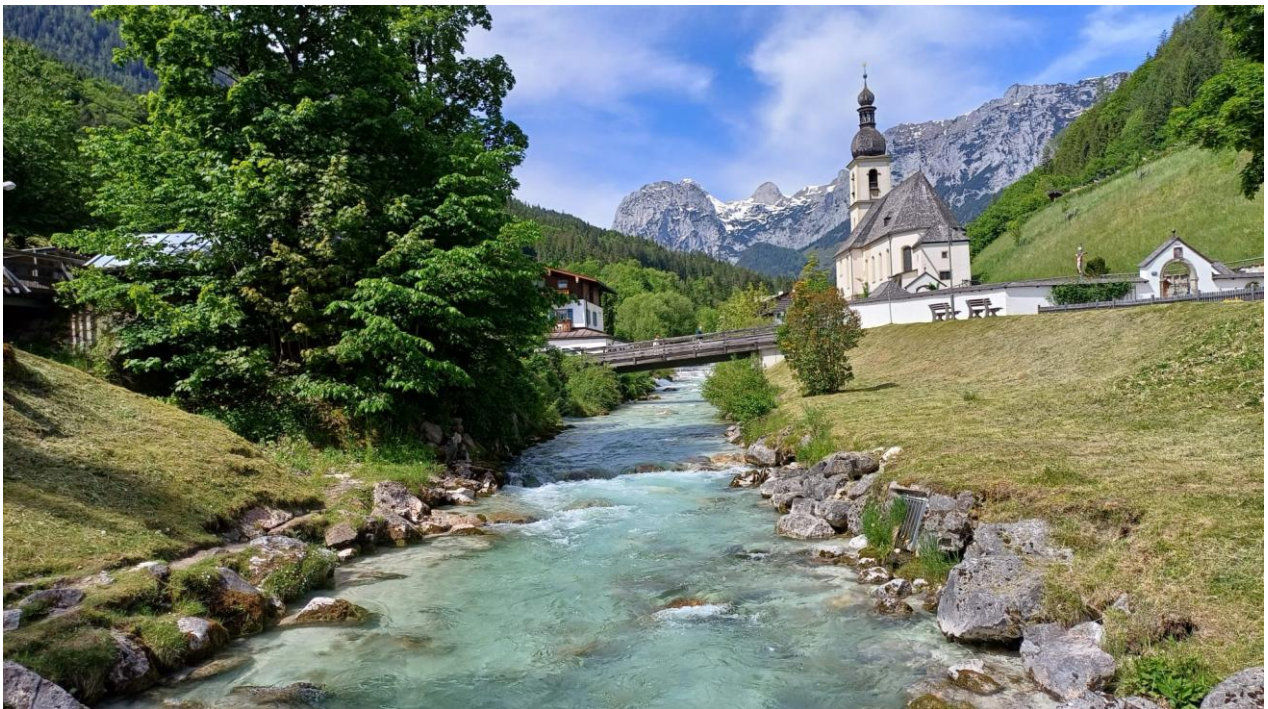
Wallfahrtskirche St. Sebastian-Ramsau